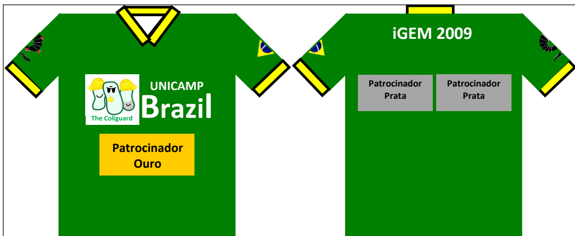
Figura 2. Frente e costas da camiseta. O logotipo do patrocinador OURO será estampado na frente, enquanto que o dos patrocinadores PRATA serão estampados nas costas da mesma.

As camisetas serão nosso principal meio de divulgação. Os 18 membros do grupo usarão as camisetas do iGEM durante todos os dias do evento em Boston, aparecendo em fotografias oficiais do evento. Serão usadas também em possíveis coberturas futuras da mídia. Patrocinador OURO contará com uma área em destaque na frente da camiseta e patrocinadores PRATA terão áreas médias nas costas da mesma (Figura 1).