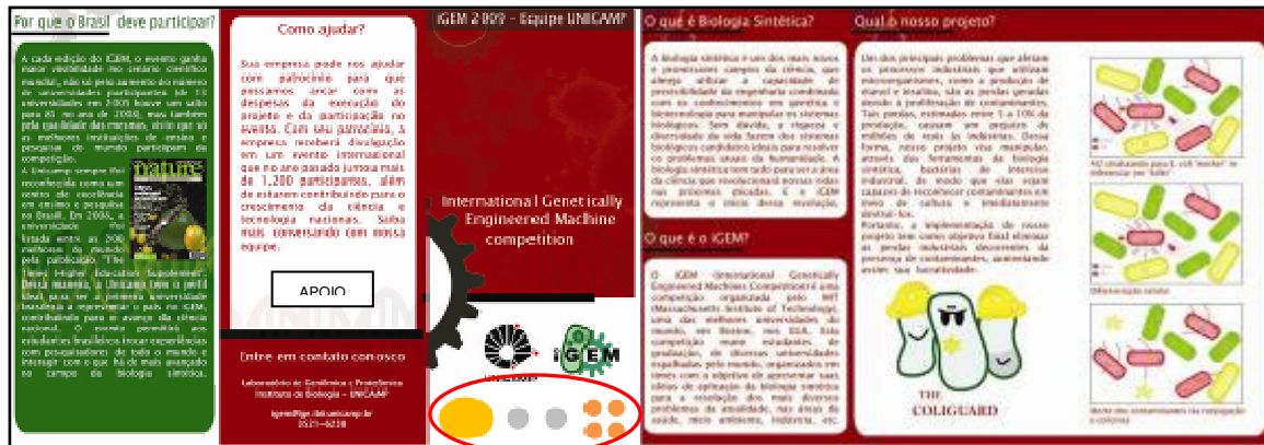
Figura 3. Panfleto de divulgação do evento e do projeto. Os logotipos dos patrocinadores serão impressos na capa (círculo vermelho). Os APOIOS aparecerão na última folha.

Serão distribuídos aos veículos de divulgação, como jornais, revistas e emissoras de TV a fim de despertar o interesse destes em divulgar a competição (Figura 3).